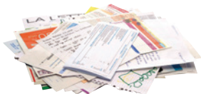
les papiers imprimés, courriers