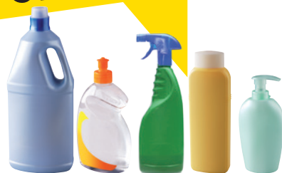
les flacons de produits ménagers les flacons de shampooing et de gel douche