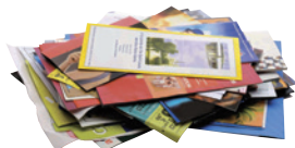
les publicités, prospectus

INUTILE D'ENLEVER LES AGRAFES, SPIRALES, COUVERTURES