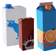
les briques alimentaires