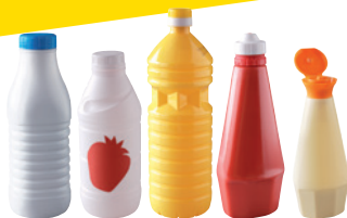
les bouteilles de lait, d'huile, flacons de ketchup, de mayonnaise