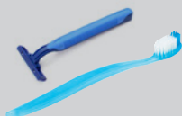
Rasoirs jetables, brosses à dents