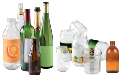
les bouteilles, pots, bocaux et flacons en verre