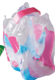
les pots de crème, de yaourt, gourdes de compote, barquettes en plastique et en polystyrène, sachets et films en plastique