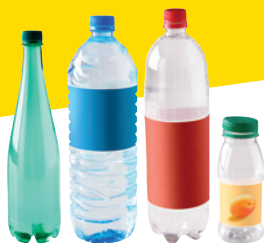
les bouteilles d'eau, de soda, de jus de fruit