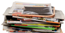
les journaux, magazines