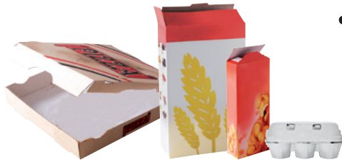
les cartonnettes (boîtes à pizza, paquets de gâteaux, boîtes de céréales, d'œufs...)